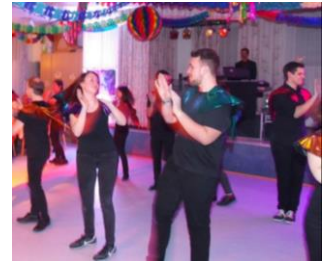
Das Jungdamen- u. Herren Komitee eröffnete mit einer fulminanten Show den Ball.