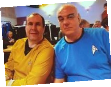
Mr. Spock und Kapitän Kirk lösten Probleme im Weltraum.

Am Samstag, 16. Februar, fand unser Pfarrfasching statt. Wir machten uns auf, zu fernen Galaxien.