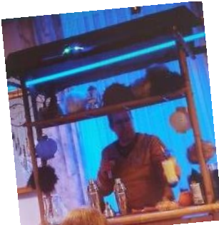
An der Bar von Käpten Kirk gab es eine Tribbles Invasion. (Tribble-kleines Pelztier)