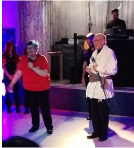
Obi Wan sprach die von allen erwarteten Worte: „Alles Walzer“