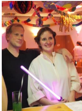
Prinzessin Lea im Gespräch mit einem Jedi.